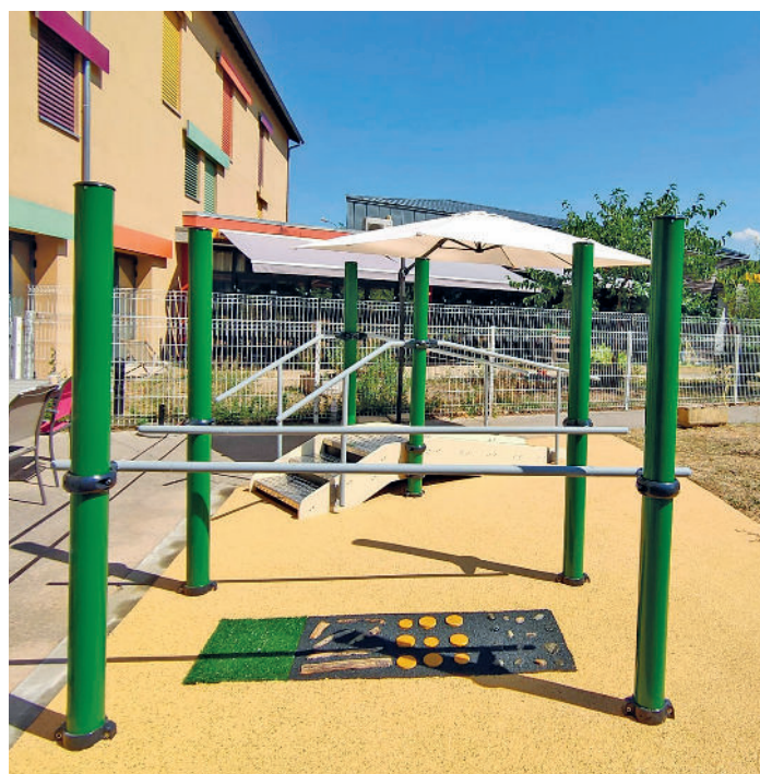
Deux modules combinés : MS001 + SPK17 Barres parallèles