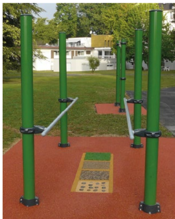
Deux modules combinés : MS001 + SPK17