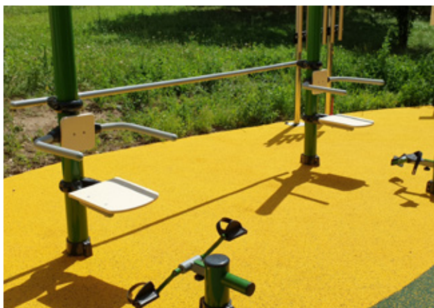
Poteau non inclus

S'installer confortablement sur le siège et appuyer le dos sur le dossier. Placer les pieds sur les pédales et les faire tourner doucement.