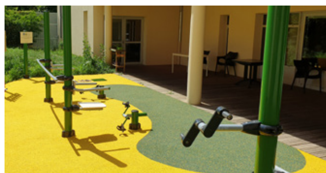
Poteau non inclus