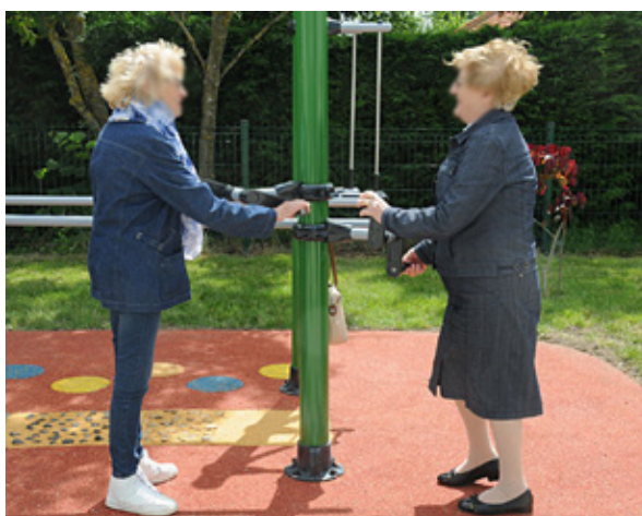
Poteau non inclus